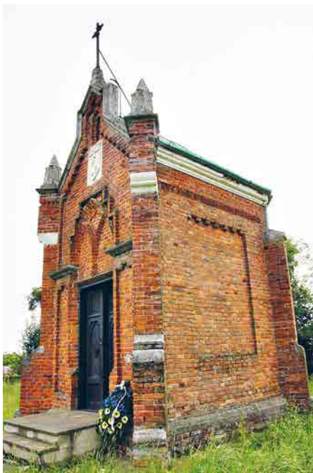
Каплиця-усипальниця роду Шептицьких.

На даний час в давньому палаці графа Фредро міститься частина Вишнянського Коледжу Львівського Національного Аграрного Університету. В буднику