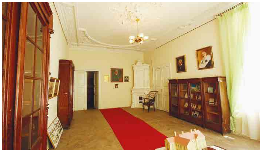
Меморіяльна кімната Александра Фредро та його внука.

палацу влаштована меморіяльна кімната Александра Фредро та його внука, Митрополита Андрея Шептицького.