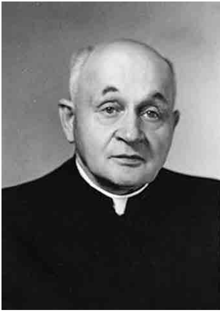
Отець митрат Мирослав Ріпецький.

29 квітня 1974 р. в с. Хшаново в Польщі помер Мирослав Ріпецький, священник УГКЦ, капелан УГА, літератор, громадський діяч, невтомний борець за права та ініціатор відродження УГКЦ на теренах Польщі. Народився у Самборі на Львівщині 1889 р.