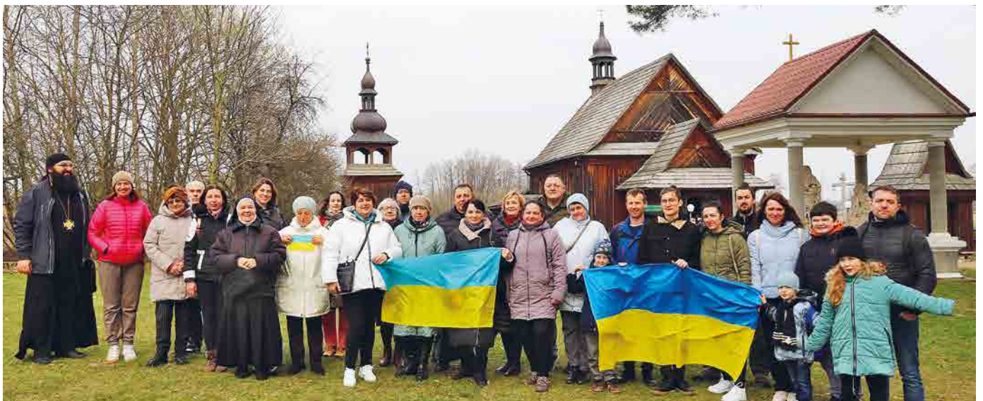
Прочани від білостоцької парафії Святої Трійці.

Дерев'яна церква в Пратуліні була збудована на кошти римо-католицького шляхтича Томи Островського у 1686 р. на місці давньої. У цьому ж самому місці, на цей раз на кошти російського (Закінчення на 11 сторінки)