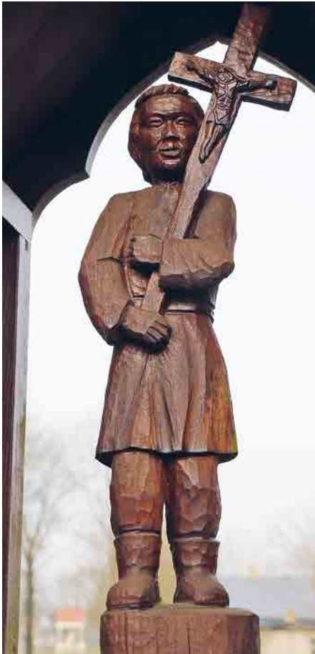
Статуетка блаженного Вінкентія Левонюка в одній з капличок, що встановлені довкола храму в Пратуліні.

території Підляшшя, де російська політика не встигла зліквідувати брацтв, до яких належали навіть до кількадесяти відсотків членів даної парафії. Це була традиція самоорганізації на захист своєї традиції й тотожності... У Пратуліні дійшло до фізичного