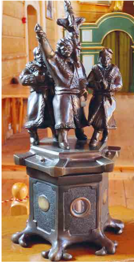
Релікварій з мощами Пратулинських Мучеників.

території Підляшшя, де російська політика не встигла зліквідувати брацтв, до яких належали навіть до кількадесяти відсотків членів даної парафії. Це була традиція самоорганізації на захист своєї традиції й тотожності... У Пратуліні дійшло до фізичного