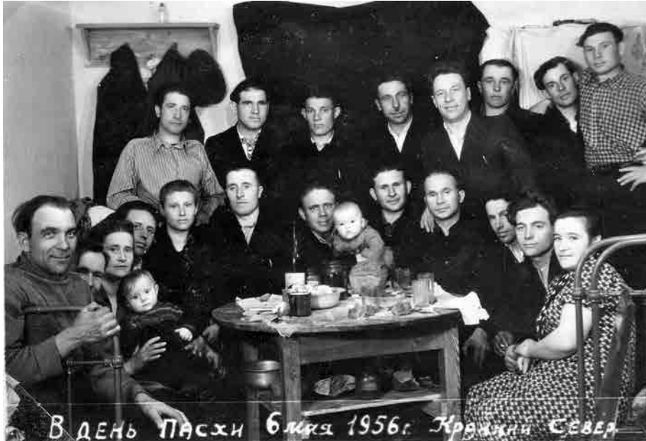
Святкування Пасхи зісланцями в далекому Сибіру.

провладні органи прагнули викрити підпільні громади греко-католиків. Відповідно через це, священники та вірні мусіли бути дуже обережними у проведенні богослужінь та здійсненні церковних обрядів. Такий розвиток подій мав вплив і на святкування релігійних свят.