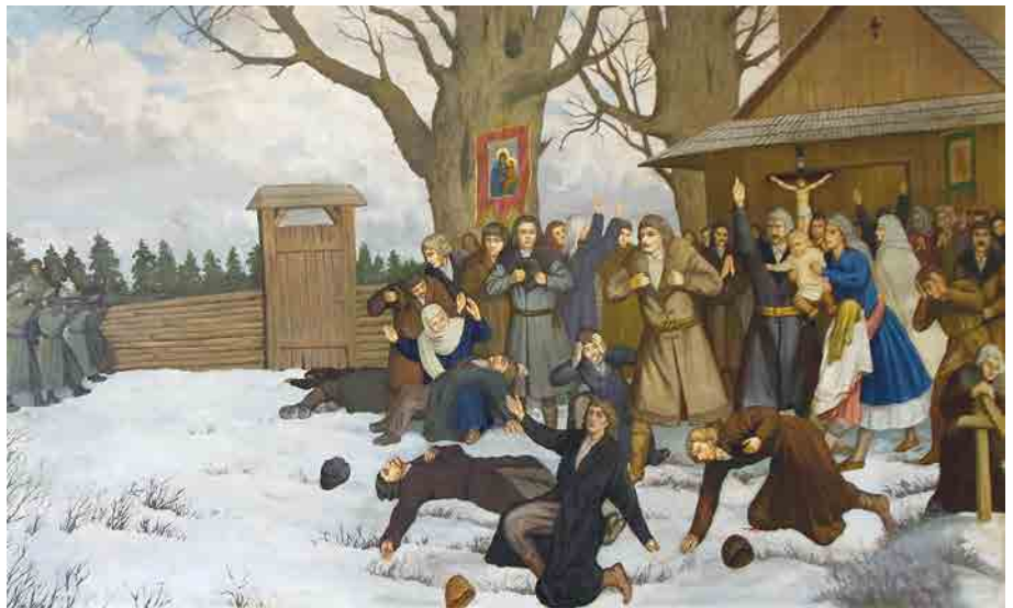
Віряни стають на захист своєї церкви в Пратуліні — картина у храмі Святих Апостолів Петра і Павла.

Тема спільних душпастирських заходів, між іншими, появилася під час III Сесії Синоду Єпископів Перемисько-Варшавської Митрополії, що відбулася 27 листопада 2023 р. у Варшаві в приміщеннях монастиря Успення Пресвятої Богородиці отців чину св. Василя Великого. У Синоді взяли участь: Архієпископ Євген Попович — Митрополит Перемисько-Варшавський, Владика Володимир Ющак ЧСВВ — єпарх Вроцлавсько-Кошалінський, Владика Аркадій Трохановський — єпарх Ольштинсько-Гданський. Так, отже, було вирішено правлячими членами Синоду, організувати як першу в 2024 році, 16 березня, спільну прощу до Пратулина з нагоди 150-ї річниці смерті Пратулинських Мучеників. Прощу було заплановано як один із заходів