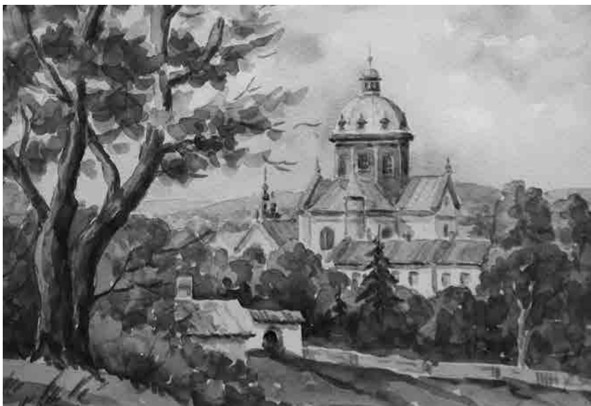
Катедра св. Івана Хрестителя в Перемишлі. Перша пол. ХХ ст.