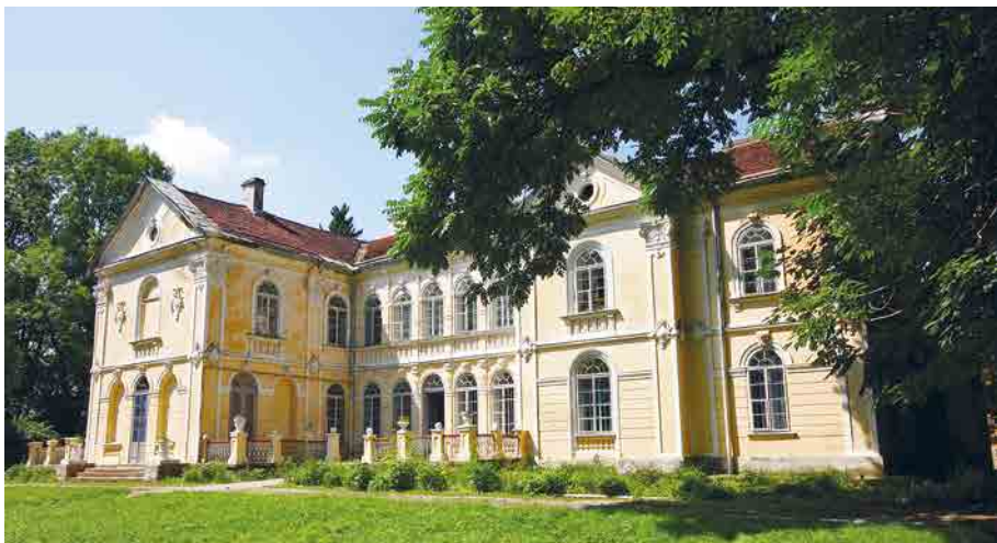
Палац Фредрів-Шептицьких у Беньковій Вишні.