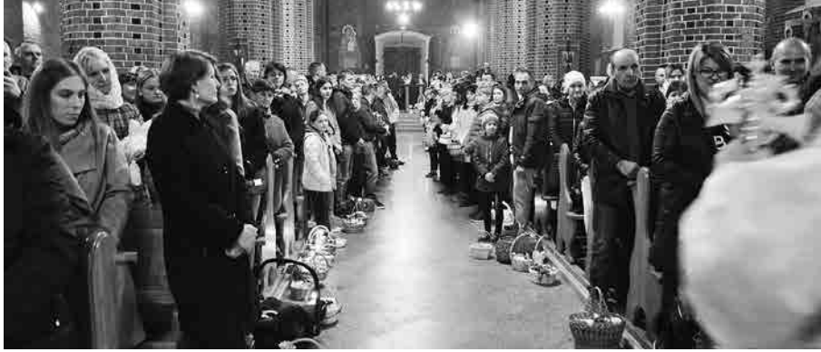
Пасха 2022 р. Собор Воздвиження Чесного Хреста.

Сьогодні особлива Пасха — з причини пандемії та санітарних обмежень, майже без людей. В церквах у літургії може брати участь максимально п'ять осіб.