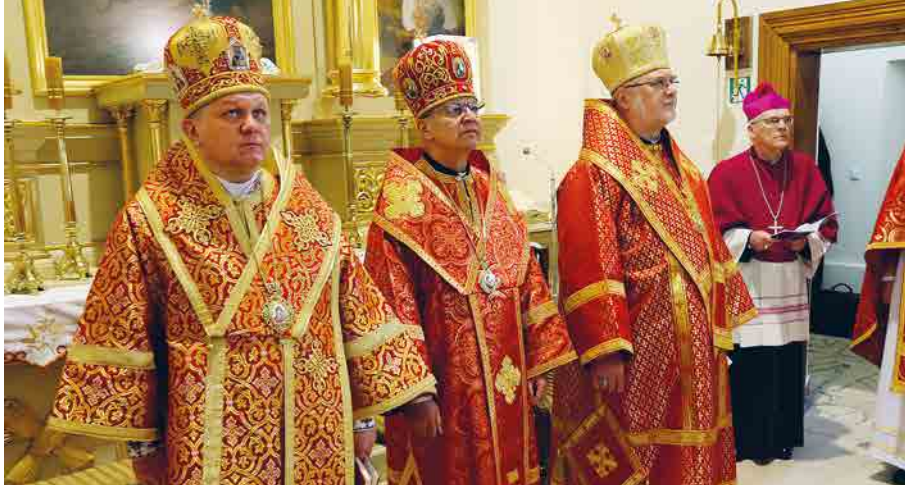
Божественну Літургію очолили чотирьох єпископів Католицької Церкви.

Подією, що можна сміливо назвати її успішно зреалізованим проектом, стала березнева проща паломничих груп від трьох єпархій нашої Церкви в Польщі та владик до підляського Пратулина й місяця мученицької смерті Підляських Мучеників.