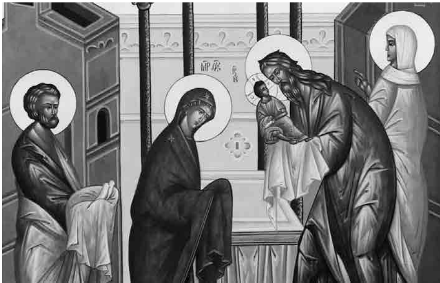
Ікона Стрітєння Господнього (2 лютого).

Великодніа, знову вітаються «Слава Ісусу Христу!». Від Великодня і до середини Вознесінням (13 червня) включно (Вознесіння завжди припадає на четвер)