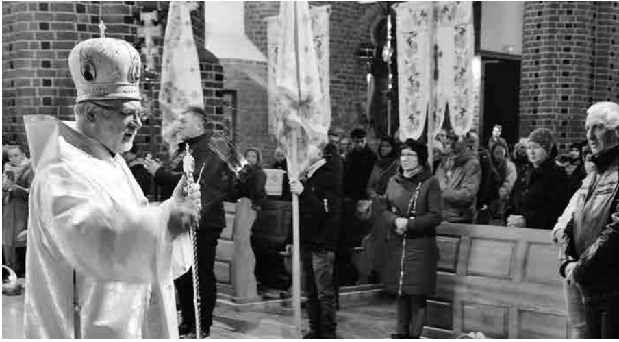
Пасха 2023 р. Собор Воздвиження Чесного Хреста.

Після Божественної Літургії було ще свячення пасок та мировання. До мировання приступила тільки частина вірних, біля п'ятсот осіб. Інші скоріше пішли додому. Всіх могло бути близько тисяча осіб. На моє відчуття, так багато людей на нічних відправах не було в нашому соборі ще ніколи від часу, як ми їх запровадили.