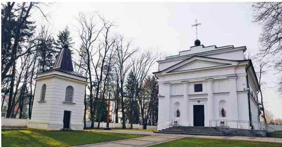
Пратулинський костел Святих Апостолів Петра і Павла.

з метою підготувань до ювілейного 2025 року.