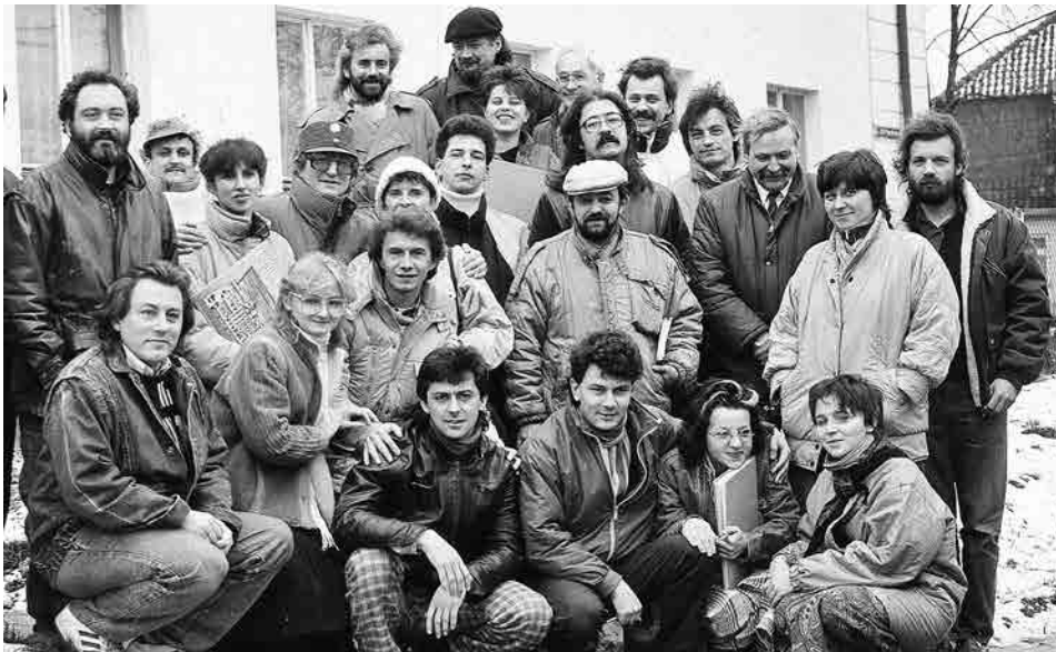
На світлині з львівським театром-студією «Не журиш».

ниві у фольклорному колективі «Думка». Тут Мирон виявив неабиякі здібності — співав, грав на кількох інструментах, танцював народні українські танці.