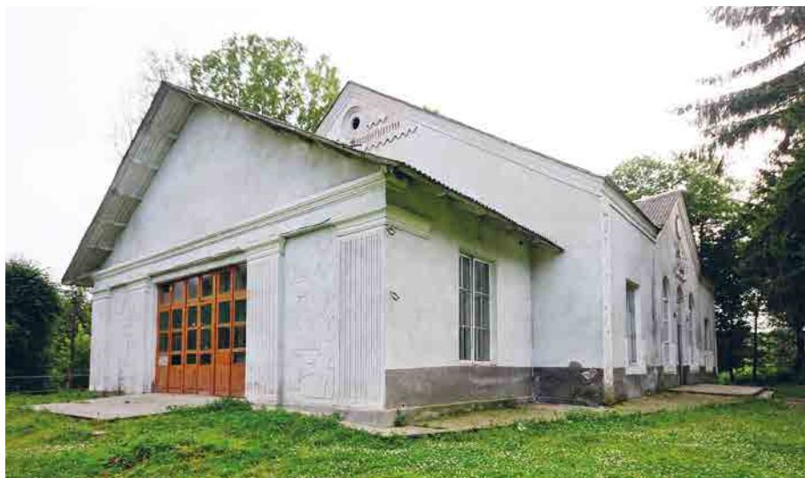
На місці двора Шептицьких збудований колгоспний будинок культури.

пальниці колгосп зберігав хімікати. У 2004 році з ініціативи і за участю патріяршої курії УГКЦ родинну усипальницю повністю було відновлено. Над входом встановили реконструований герб (понищений зберігається у самій каплиці). В крипті впорядковано саркофаги з тлінними останками роду Шептицьких. →