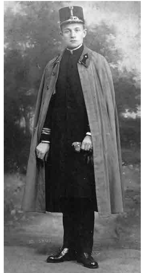
В рядах УГА.

Про Хшаново та о. митрата Мирослава Ріпецького згадує Владика Петро Крик: «На великі відпустові свята (Різдво, Великдень, Зелені Свята, св. Апостолів Петра і Павла, Внебовзяття Пресвятої Діви Марії та інші) до Хшанова прибували сотні, а часом може й тисячі людей. Це була наша Мекка в Польщі. Тому, хто пам'ятає ПНР, можливо буде важко повірити, але справді так було, що ПКП (польська залізниця) часом добавляла вагонів, часто товарного типу, щоби всі бажаючі змогли приїхати і від'їхати. Тут треба зазначити, що люди приїжджали навіть зі Щецинського та Вроцлавського воевідств (700 кілометрів!). Згодом, коли я душпастирював на тих теренах, я зустрічав цих людей