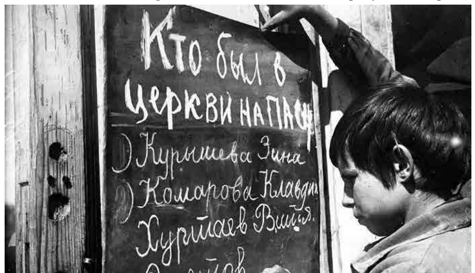
Совітська влада всякими способами намагалась відтягти наймолодших від Церкви.