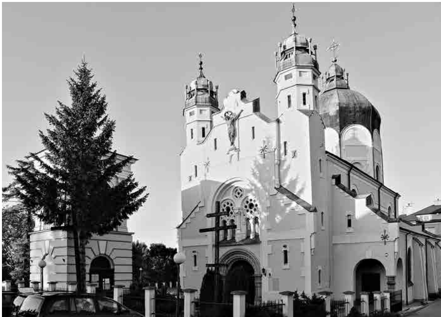
Ярослав. Храм Преображення Господнього.

Перша — це коронація папськими коронами, яка мала місце в нашій новітній історії в 1996 році, коли папський легат Кардинал Алкіле Сільвестріні, в асисті перемиського єпископа Високопреосвященнішого кир Івана, наклав на її голову