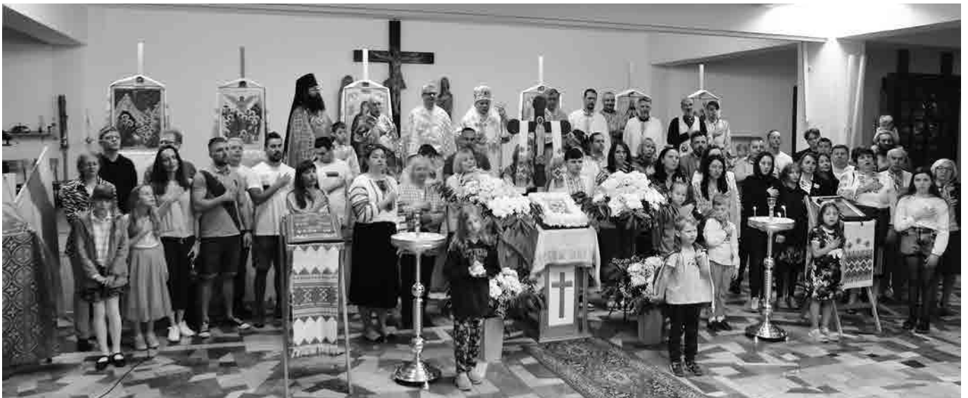
Спільнота парафії св. Трійці в Білостоці з Владикою Аркадієм Трохановським.

й того тримаймося виповнюючи заповіт Ісуса Христа. А це важливе. У сьогоднішньому Євангелії від св. Івана Ісус Христос говорить про ненависть до тих, хто Його не любить. Тим самим хоче і нам сказати — хто вірить в Бога, того віра завжди виставлена на випробування (Ів. 15.19). І Христос мовить (Закінчення на 15 сторінці)