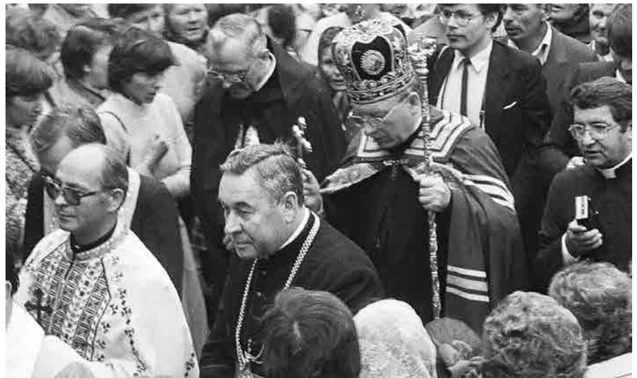
Владика Мирослав Марусин з пастирським візитом в Гурові Ілавецькому (1984 р.).