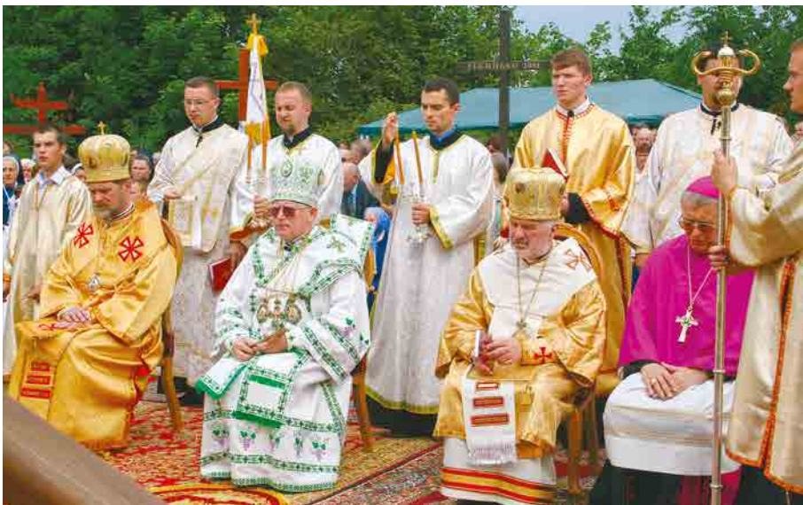
Хшаново. Празник святих Петра і Павла. 16 липня 2005 р.

Із всупного слова Ольштинсько-Іданського Владика Аркадія Трохановського до фотоальбому присвяченого ювілеям Митрополита-сеньйора Івана Мартиняка: «Коли мені сповнилося 16 років, я взяв участь в історичній події, →