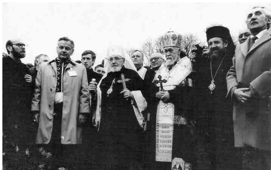
30 березня 1991 року Глава УГКЦ Мирослав Іван Любачівський повернувся до України.