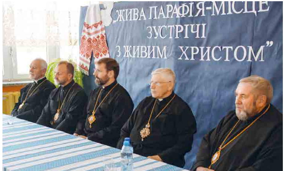
Гурово Ілвецьке. Зустріч з Блаженнішим Святославом Шевчуком. 29 червня 2013 р.

90-ті роки XX століття були часом інтенсивного розвитку Греко-Католицької Церкви в Польщі. Саме ця робота принесла реальні результати. У 1996 році було утворено Перемисько-Варшавську Митрополію очолену Владикою Іваном Мартиняком, призначеним і піднесеним до сану архиєпископа та