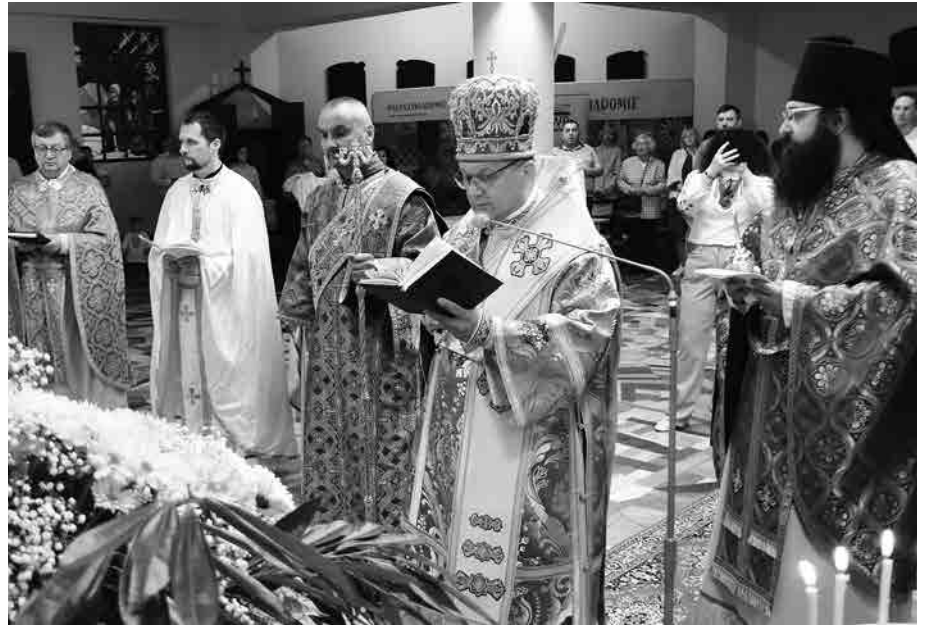
Чин освячення напрестольної ікони Супраської Богородиці.

Урочиста літургія в білостоцькому римо-католицькому храмі Святого Духа, де греко-католики знайшли прихисток від дня заснування парафії, почалася від посвячення копії Супраської Богородиці, тетраподної ікони в сріблі.