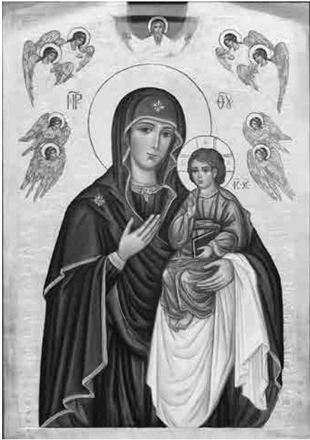
Чудотворна ікона Супраської Богородиці.

До свята Супраської Богородиці, між іншими, віднісся ольштинський ординарій: «Сьогоднішнє свято поклоніння іконі Матері Божої з Супрасля вчить нас приходити до Богородиці постійно та з терпеливістю очікувати її заступництва. Вона, як Небесна Матір, хоче завжди бути з нами, в різних моментах нашого життя. Будьмо з Нею, бо вона для нас. Вона також вчить нас любити і в цьому їй наслідуймо. Нехай слова: „Це мати Твоя” будуть нашими словами, пригадаймо їх собі за кожним разом