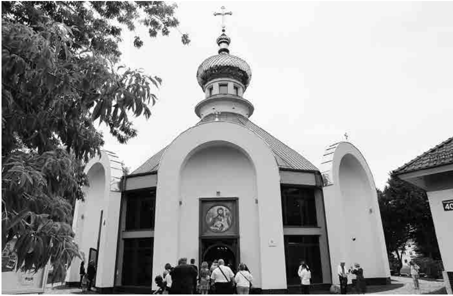
Храм Різдва св. Івана Хрестителя в Ельблонгу.

Для престолу новозбудованої церкви хай будуть приготовані нові верхній і нижній обруси, які будуть освячуватися перед одяганням, а також всі належні предмети, тобто Євангеліє, хрест, кивот і світильники, які мають бути освяченими, або ж освячуватимуться після одягання престолу. Всі ці речі разом зі святим антимінсом хай стоять на окремому столі у вітварі».