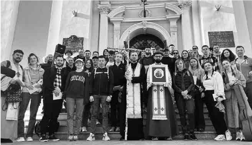
Перед катедральним храмом св. Івана Хрестителя.

В дорозі не було часу, щоби засумувати, з нашими то отцями — це щось з іншої реальності, за що ми їм дуже вдячні. Постійний позитив, молитви на вервиці, пісні прослави Богородиці та її Сина, а Бога нашого Ісуса Христа — все це було настільки атмосферно, що навіть пишучи ці рядки, думками та духом знову і знову переживаєш цю прощу. Непомітно, в лісі, серед густої зелені, нас велично зустрів костел, який