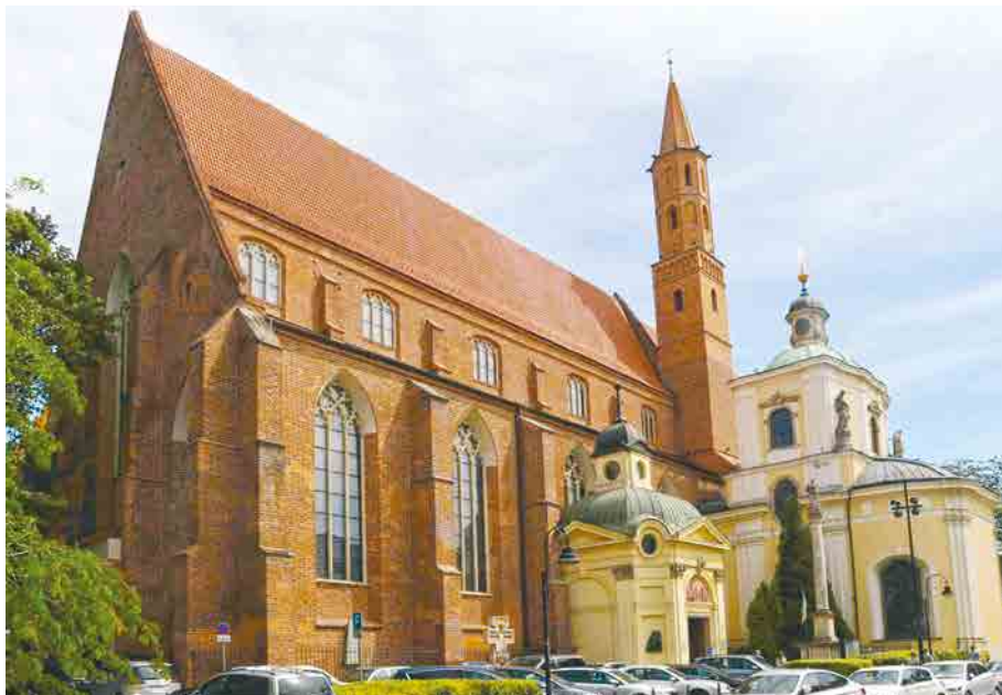
Катедральний собор Вроцлавсько-Кошалінської Єпархії УГКЦ.

Сьогодні, маючи за собою досвід колишнього члена лігницької парафіяльної спільноти, учня українського ліцею, студента й монаха ЧСВВ, священника у кількох парафіях, єпископа, Владика Володимир Юцак у своєму слові особливе місце призначив українській родині, своїм парафіянам і, зокрема, священничим сім'ям: «Дякую сердечно дружинам наших священників. Тішуся, що ви є сьогодні в нашому соборі, що на дорозі приїзду до Вроцлава не станули Вам ніякі перешкоди. Наші отці відповідають за духовну опіку над вірними нашої Церкви, а щоденну опіку над отцями несе те ви, їхні дружини. Деколи може навіть наші отці не усвідомлюють, як багато завдячують вам, також коли йдеться про їхні фізичні, психічні та духовні можливості більшої посвяти себе душпастирській праці. Сердечно вас вітаю та дуже дякую за все, що безпосередньо і посередньо робите для Церкви». Маючи на увазі також ситуацію, яка виникла у світовій спільноті після московитської агресії в Україну та її суспільність Владика відзначив присутність серед нас її громадян: «Сьогодні наші парафії, головні у більших містах, утворюють вже не лише виселенці акції "Вісла" та їхні нащадки, але у великій мірі також новоприбулі до Польщі громадяни України. Радіємо,