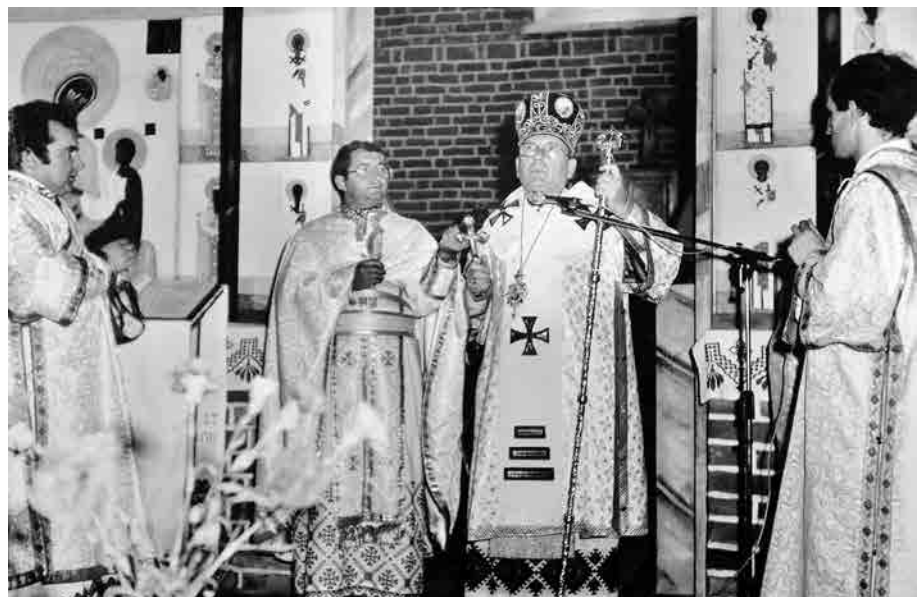
Перед іконостасом храму Воздвиження Чесного Хреста в Гурові Іл.