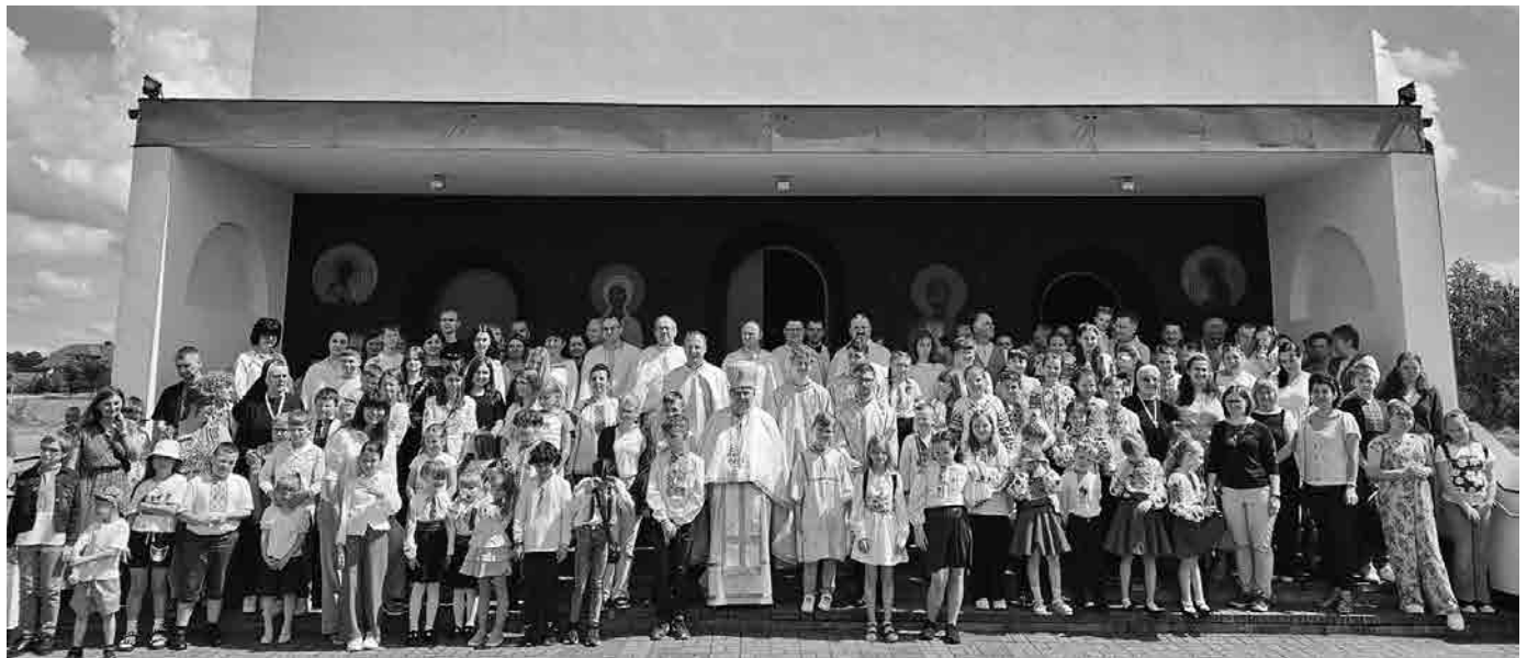
Учасники XXX Фестивалю української сакральної творчості в Білому Борі