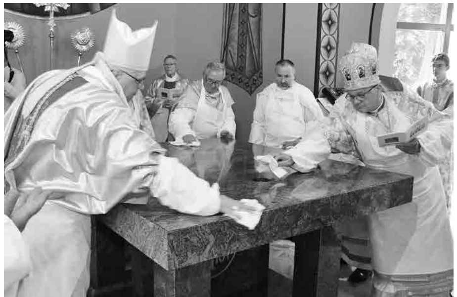
Чин освячення престолу й запечатання мощей.

Тішимося, що можемо разом брати участь у цій радісній події. Ми так численно зібрані, підтримуємо місцеву спільноту. Це знак надії, це свідцтво, що громада хоче мати свій храм і хоче бути за це відповідальна, щоб усі, хто тут буде приходити, освячував себе Божим Словом, Святими Таїнствами, молитвою. Ми також показуємо, що ми не здаємося,