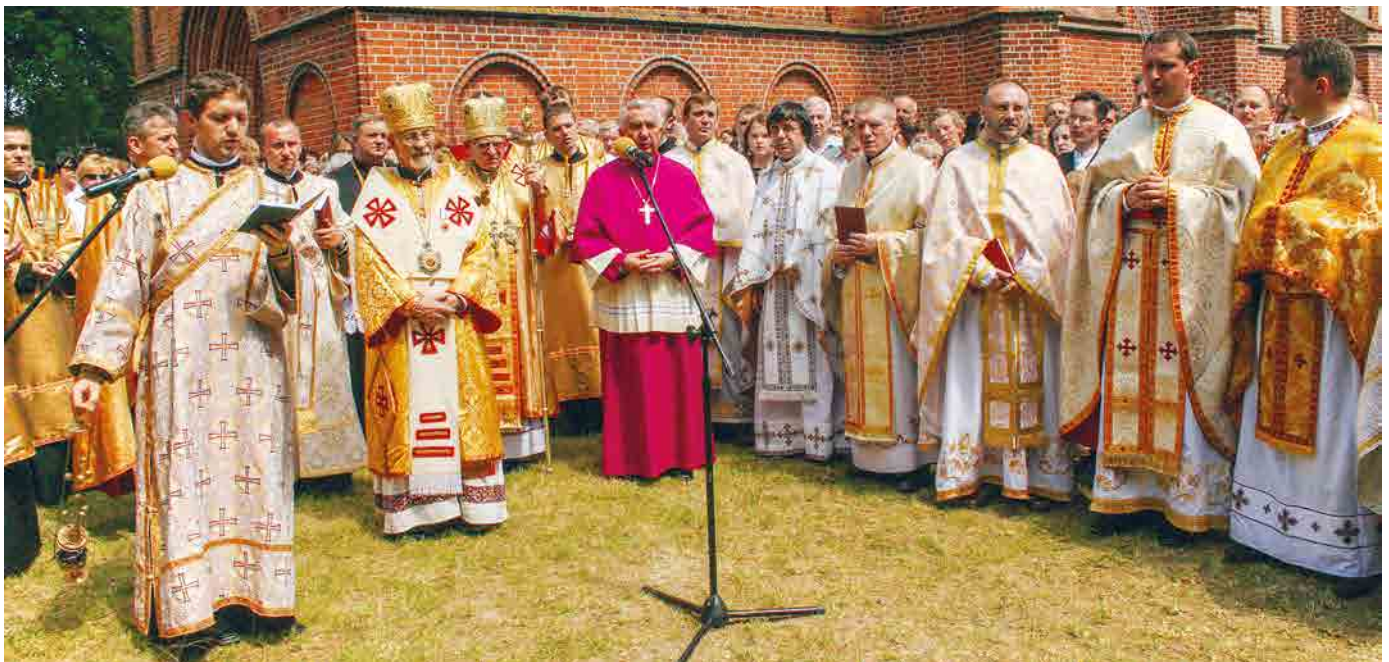
Гурово Ілвецьке. Ювілей 50-ліття парафії. 9 червня 2007 р.

Була заснована структура, якої раніше не існувало і про яку було важко думати. Це сталося завдяки праці архиєпископа Івана Мартиняка, яка не припинялася. Це надалі душпастирська →