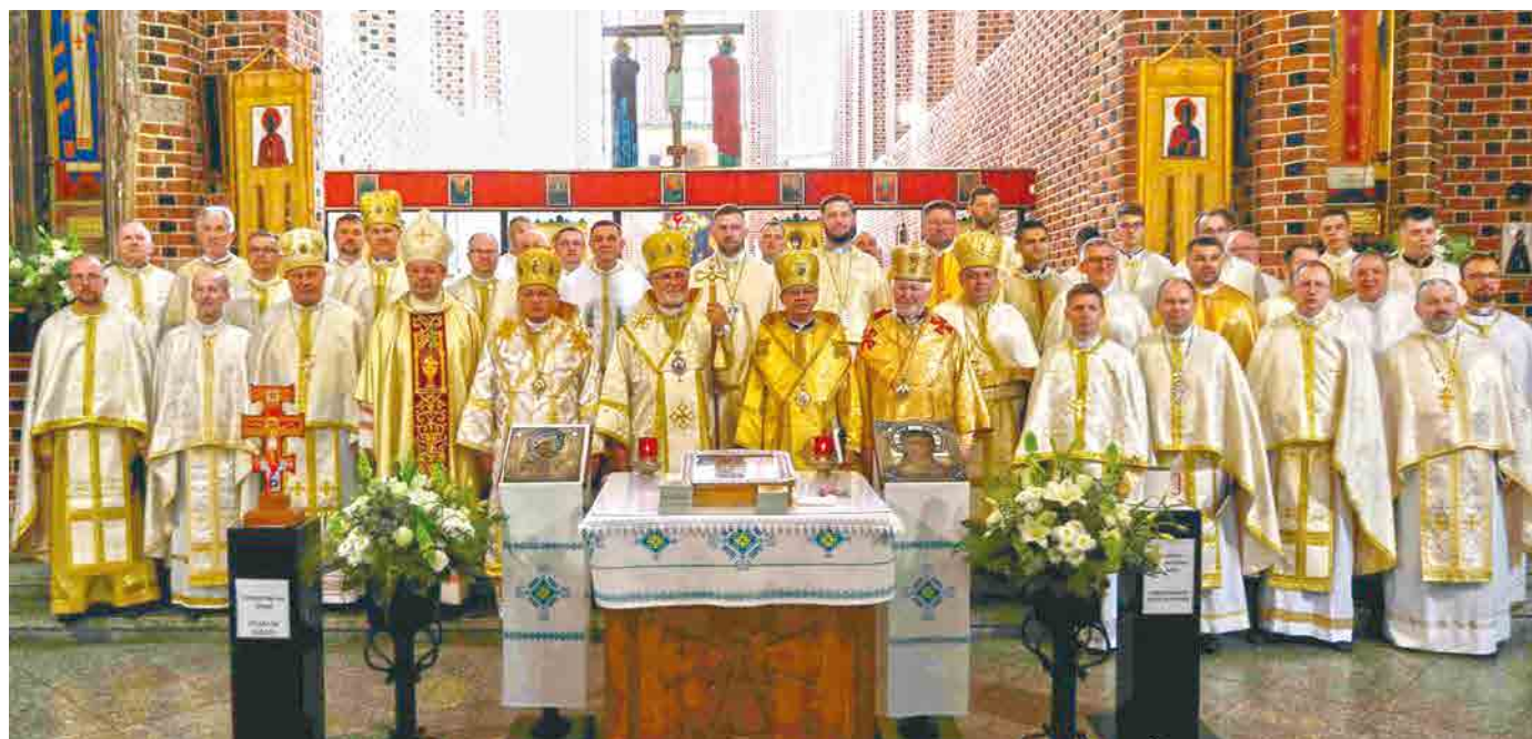
Спільна світлина з владикою-ювілянтотом на закінчення торжества у вроцлавській катедрі Воздвиження Чесного Хреста.