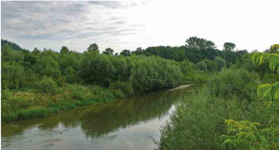
Річка Дністар недалеко Спаса.

важких та особливо переломних часах, тому Ви також зобов'язані залишити про ці часи, про свою тодішню працю, своє свідчення. Без сумніву багато ви записали, багато розповідали про ці минулі часи, але варто ще більше записати, награти, розповісти, щоб пам'ять про них не пропала.